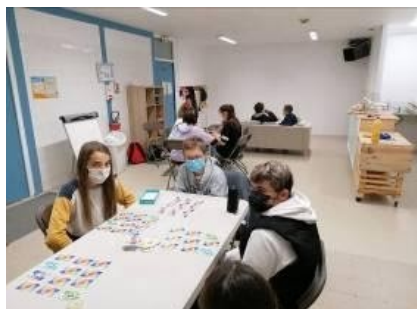
La salle CasAdos